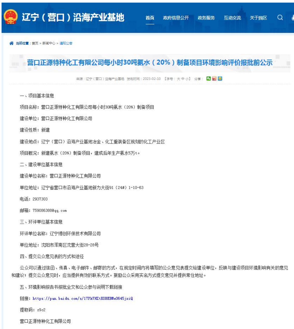
图 6-1 项目报批前信息公示截图