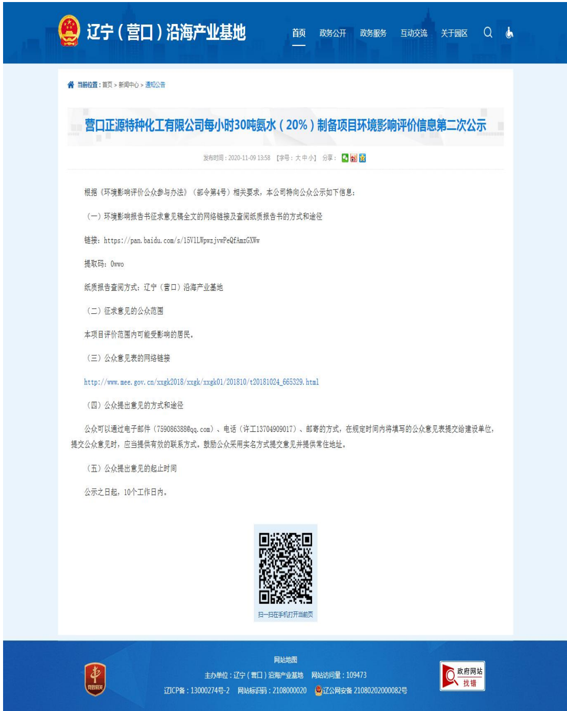
图 3-1 项目第二次信息公示截图