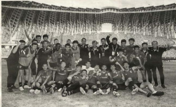
辽宁沈阳城市队赛后合影。

11月8日,中甲联赛进行了常规赛最后一轮的比赛。在梅州赛区,辽宁沈阳城市队在两球落后的情况下,全队凭借拼到最后一秒的信念,在补时阶段完成绝平,2:2战平新疆雪豹纳欢,拿到宝贵的1分,以1胜2平2负积5分的战绩直接保级成功。