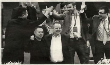
11月8日,中国乒协主席刘国梁(前排左)与国际乒联首席执行官丹顿(前排右)庆祝比赛重启。

目前,绝大多数参赛选手已经抵达威海,最后一批选手已于10月27日展开训练。而本次比赛的关键队员全部来自国内,并于赛前接受了隔离检测。威海世界杯后,多数参赛选手将转战郑州,参加19日至22日的总决赛。与世界杯不同,总决赛面向观众开放,门票预售已于6日展开。25日至29日,WTT“首秀”系列将在澳门上演,全新赛制和比赛形式